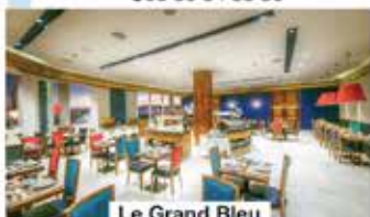
Le Grand Bleu

📍 Hôtel Kenzi Solazur Avenue Mohammed VI ☎ 05 39 34 83 83