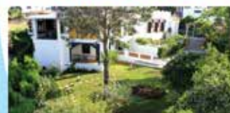
Riad Dar Achaach 05 39 97 46 74