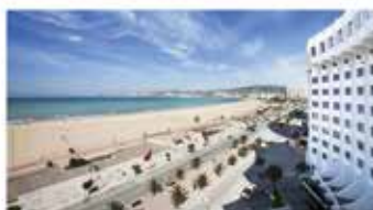
Kenzi Solazur and SPA ☎ 05 39 34 83 83 / 05