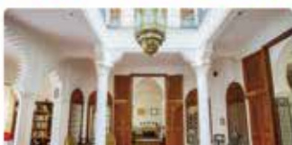
Blanco Riad 05 39 97 46 74