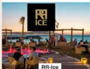
RR-ICE 05 39 30 10 39