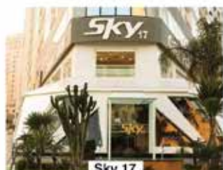
Sky 17 05 39 32 31 00