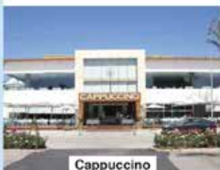
Cappuccino 05 39 30 26 63