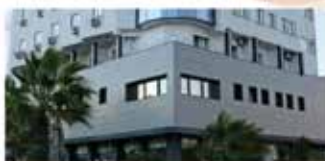
El Yacouta 05 39 99 69 78