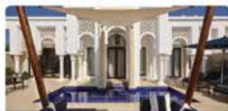
Banyane Tree 05 39 66 99 99