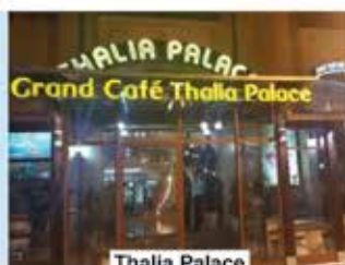
Thalia Palace 05 39 34 30 49