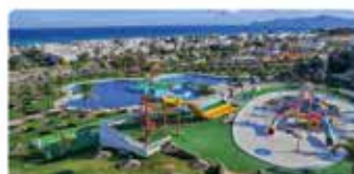
L'Escale 05 39 97 72 68