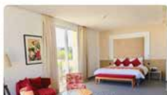
Mandarin Palace & SPA