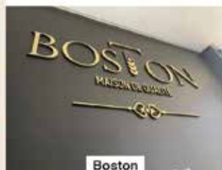
Boston 05 39 33 34 32