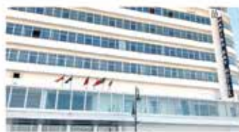
Marina Bay ☎ 05 39 34 93 00