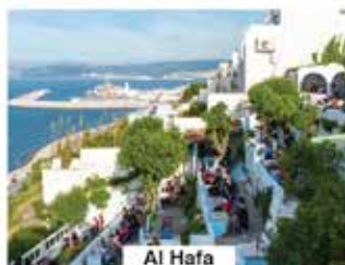
Al Hafa 06 47 59 21 21