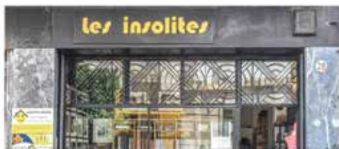
28 rue Khalid ibn Oualid (ex-Velazquez) - Tanger Tél : 05 39 37 13 67