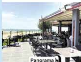
Panorama 05 39 94 63 31