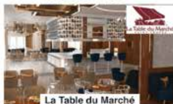
La Table du Marché

📍 Zone touristique El Ghandouri ☎ 05 39 30 23 67