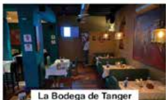
La Bodega de Tanger

📍 Palais des institutions italiennes ☎ 05 39 93 63 48