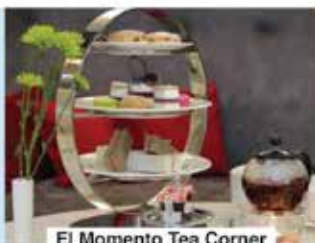
El Momento Tea Corner 05 39 30 90 00