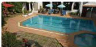
Hacienda 05 39 68 86 68