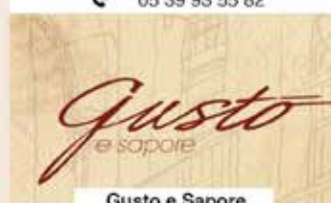
Gusto e Sapore

📍 Place du Tabor, Kasbah ☎ 05 39 94 81 39