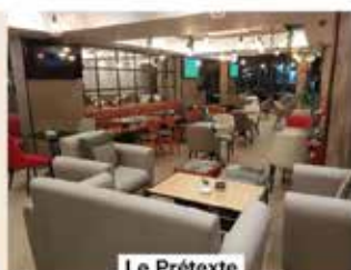
Le Prétexte 05 31 60 51 44