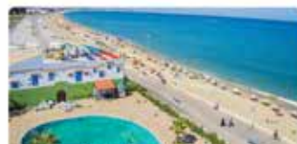
Golden Beach 05 39 97 51 37