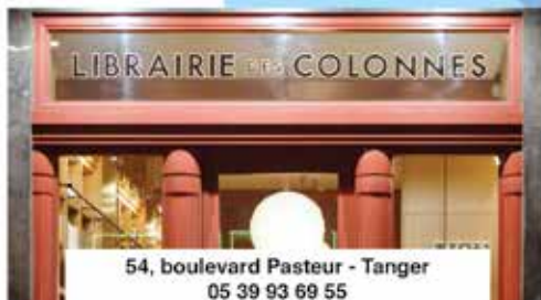
54, boulevard Pasteur - Tanger 05 39 93 69 55

Pendant plus de 60 ans, la Librairie des Colonnes s'est imposée comme un lieu de culture, ouvert et pluriel, où les arts et les lettres se donnaient rendez-vous. Sauvée par Pierre Bergé d'une disparition certaine, menée par une nouvelle équipe, elle a retrouvé fin 2010 tout son éclat et tend à redevenir, à travers de multiples projets, un acteur majeur de la ville. La Librairie des Colonnes naquit un jour d'été 1949, sur le Boulevard, quand le monde entier se donnait rendez-vous à Tanger.