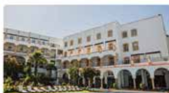
El Minzah ☎ 05 39 33 34 44