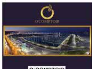
O'COMPTOIR 05 39 33 59 95