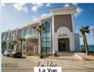
La Vue 05 39 31 11 12