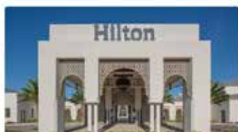
Hilton Tangier Al Houara Resort & Spa ☎ 05 39 40 94 00