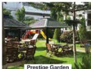
Prestige Garden 05 39 32 10 01