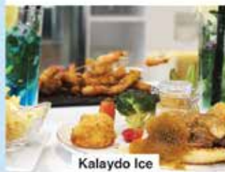
Kalaydo Ice 08 08 50 48 84