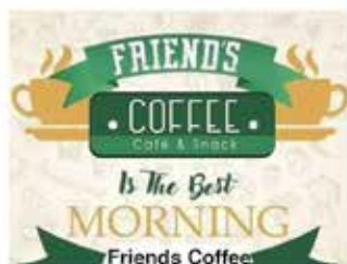
Friends Coffee 08 08 55 88 18