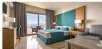
Suite Hotel Omeya 05 39 68 82 70