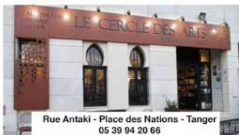
Rue Antaki - Place des Nations - Tanger 05 39 94 20 66

Implanté au cœur de Tanger, le café culturel « Le Cercle des arts » vous propose une carte menu diversifiée pour déguster un thé-café ou pour siroter un jus naturel tout en assistant à une exposition, un concert ou une rencontre littéraire avec des auteurs et des artistes.