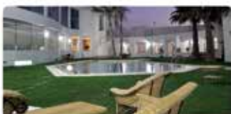
Chams 05 39 99 09 01