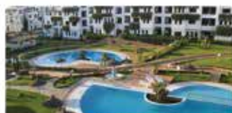
Marina Beach 05 39 66 65 16