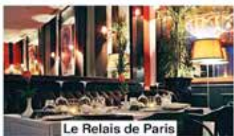
Le Relais de Paris

📍 Mandarin Palace - Zone touristique El Ghandouri ☎ 05 39 30 01 48