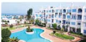
Kabila Vista 05 39 66 64 59