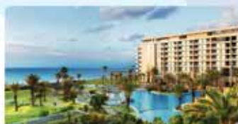
Mövenpick Casino Hotel ☎ 05 39 32 93 00