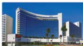
Hilton Tanger City Center & Residences ☎ 05 39 30 97 00