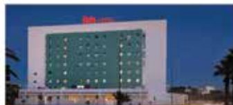
Ibis Tanger City Center