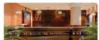
Ksar Al Majaz