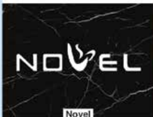
Novel 06 70 64 71 47