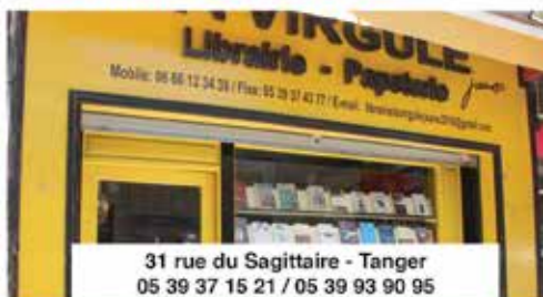
31 rue du Sagittaire - Tanger 05 39 37 15 21 / 05 39 93 90 95

La Virgule est l'une des librairies les plus actives dans la ville de Tanger. Les propriétaires proposent les services ordinaires comme papeterie ou fournitures et livres scolaires, mais c'est aussi et surtout un lieu de lecture, de débats équipé d'un espace multimédia. On y organise aussi des cafés littéraires.