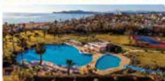
Marina Smir Hotel & SPA 05 39 97 12 34