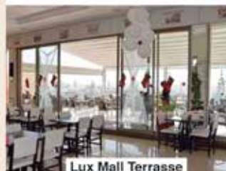
Lux Mall Terrasse 05 39 32 09 05