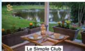
Le Simple Club